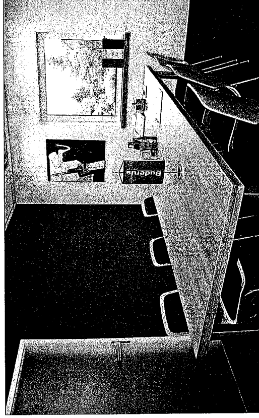
Die großzügigen Räumlichkeiten bieten natürlich auch genügend Platz um alle Interessenten eingehend zu beraten. Immerhin ist ein neues Bad oder eine moderne Heizung eine Familienatsache.

Roermonder Str. 9-11 · 41849 Wassenberg Tel. 0 24 32-9 33 47 14 · Fax 0 24 32-9 33 47 15 E-Mail: info@elmo-massivhaus.de Internet: www.elmo-massivhaus.de